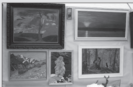
Béres Károly képei