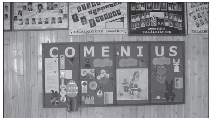
Comenius fal az iskola aulájában

dégeink olyan szép emlékekkel távoznának a hét elteltével, mint két évvel ezelőtt az előző Comenius program résztvevői.