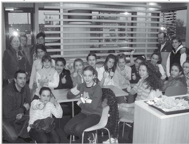
A győztes csapat és a szurkolók