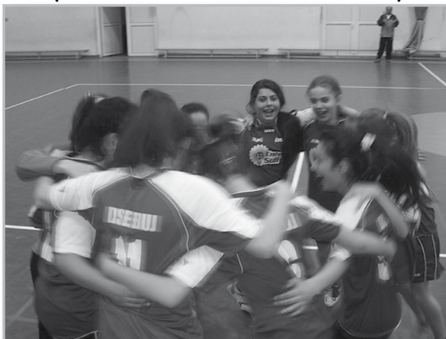
A győzelmi tánc pillanata