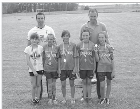
II. kcs. 2. hely