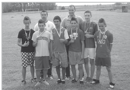
IV. kcs. Nagykörzeti 3. hely