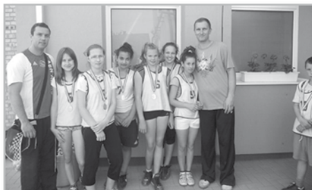
III. kcs. Nagykörzeti 1. hely