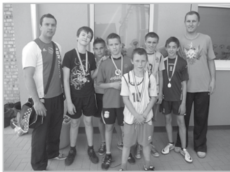
III. kcs. 2. hely