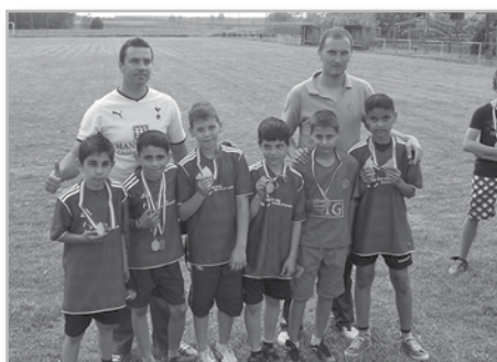
II. kcs. Nagykörzeti bajnokok