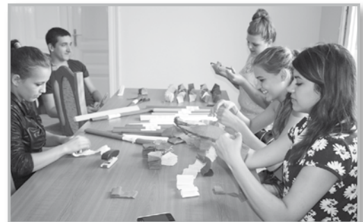
Vidám hangulatú kézműves foglalkozás

Köszönjük a Bujai Önkormányzatnak a lehetőségét, hogy újabb élményekkel gazdagodtunk, újabb mara-