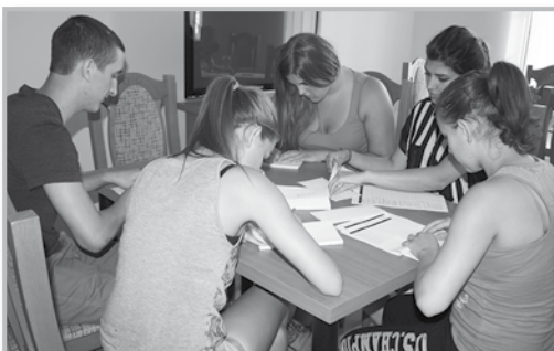
Falusi meghívók borítékolása

dandó emlékeket szerezhettünk, és bízunk benne, hogy jövőre – ha lesz még diákmunkára lehetőség, igény – újult erővel részt vehetünk majd benne, és további élményeket, boldog perceket zsebelhetünk be.