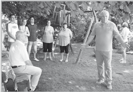
A projekt bemutatása