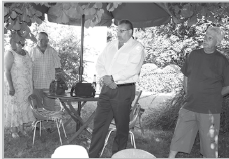
Polgármester úr üdvözlő beszéde