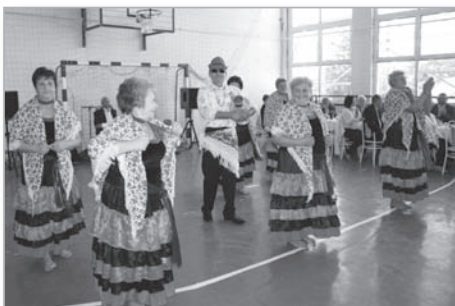
A Napfény Nyugdíjas Egyesület műsora