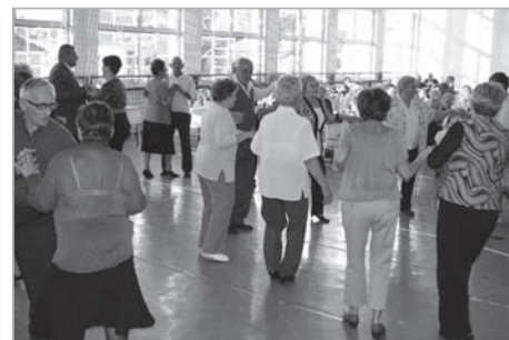
Tánc és jókedv