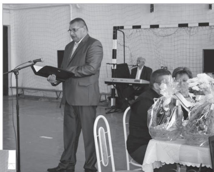
Polgármester Úr köszöntője

A mi feladatunk, hogy idős embertársaink számára olyan életkörülményeket biztosítsunk, mely lehetővé teszi számukra az öregkorhoz méltó derűs életet. A család gondoskodása mellett a társadalomnak is mindent meg kell tennie azért, hogy a megérdemelt