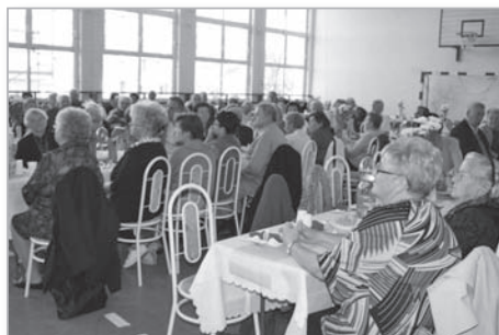
A meghívott ünnepeltek