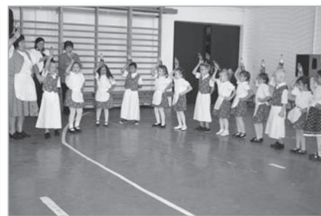
Az óvodás gyerekek műsora