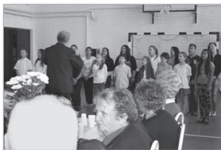
Az általános iskola énekkarának műsora